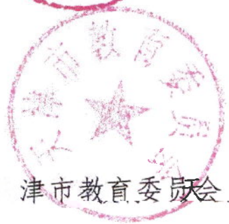
社 天津市教育委员会