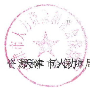
资源天津市人保障局