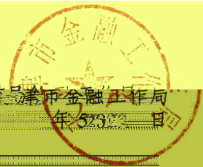
监督管理委员会天津市金融工作局